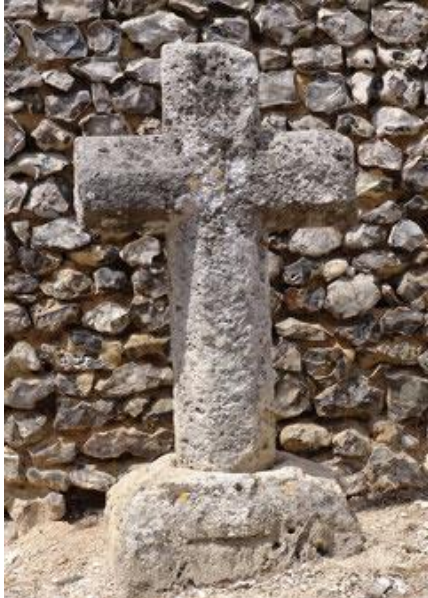
Au chevet de l'église de Toeufles

A l'intérieur de l'église, figure une belle charpente du 16 e siècle à sablières avec 14 blochets sculptés.