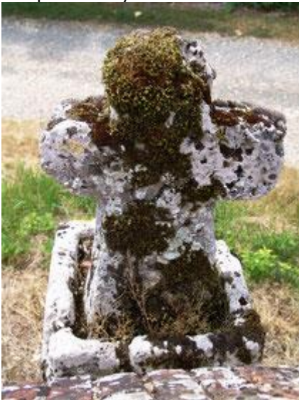
Au cimetière de Toeufles

La petite croix en tuf semble avoir été déposée dans le cube de pierre qui ressemble à un bénitier. Mais pour quelle raison a-t-elle été implantée en dehors du cimetière? Toutes les croix en tuf ont une part de mystère