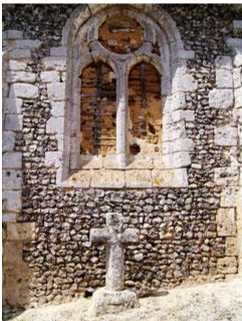
Croix en tuf au chevet de l'église