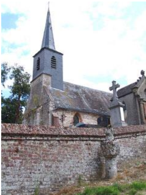
La croix extérieure au cimetière

C'est vraisemblablement une croix de tombe, reposant sur un socle également en tuf.