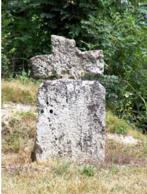
la croix de Chaussoy