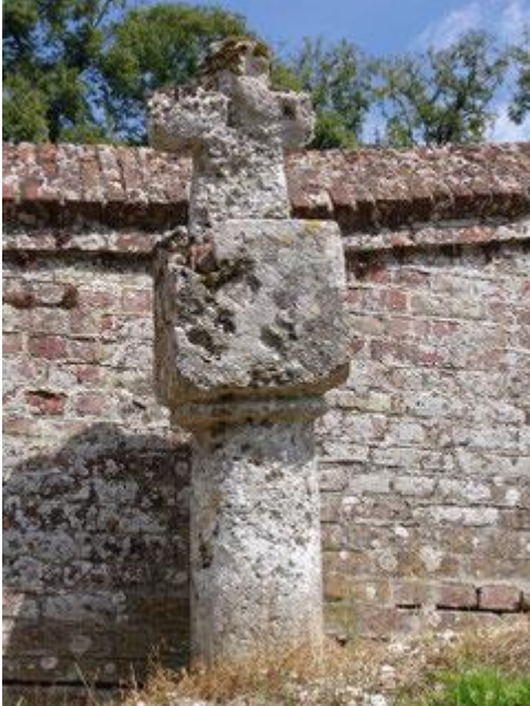
la croix extérieure au cimetière

En arrière-plan, le clocher de la remarquable église de Toeufles avec sa charpente à blochets sculptés, dresse sa croix dans un ciel truffé de nuages